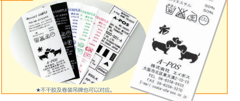
★不干胶及卷装吊牌也可以对应。